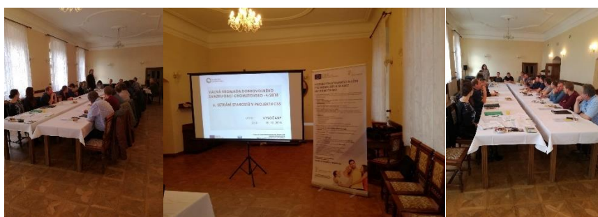
Z valné hromady ve Vysočanech.

Hrušovany, Chomutov, Nezabylice, Otvice, Strupčice a Vysoká Pec. Zastoupení obcí v kontrolní komisi zůstává stejné s tím, že došlo ke změně na pozici zástupce za město Jirkov. Bližší informace jsou k dispozici na webových stránkách svazku: www.dso-chomutovsko.cz .