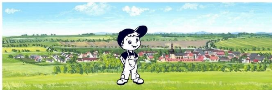
Výlet „Pro nejmenší – babičko, dědečku vyprávěj“.

Pracovní skupina k tématu cestovní ruch, složená se zástupců měst a obcí, se sešla dne 4.12.2018 a shodla se na zadání jazykových mutací aplikace v Aj, Nj.