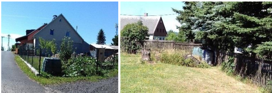
Dodávka a umístění kompostérů do obcí v 1. projektu.