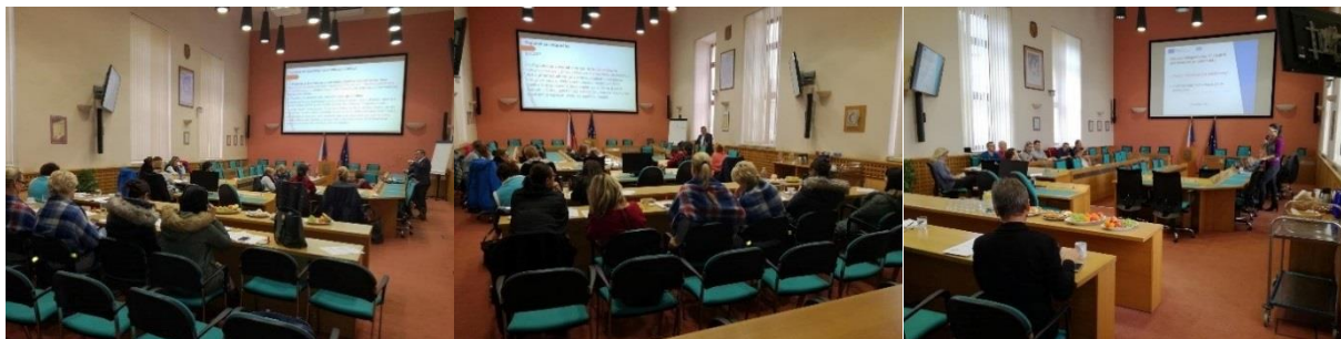
Seminář – místní poplatky a elektronizace veřejných zakázek.

I v letošním roce jsou připravena zajímavá témata školení. Hlavním cílem pokračování je zvýšit kvalitu odborných a obecných kompetencí zástupců členských obcí školením v těchto tematických okruzích: elektronizace veřejných zakázek, základní registry, rozpočtová skladba 2019, správní řízení, zákon o obcích atd.