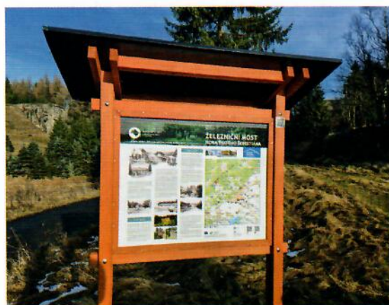
Nová turistická trasa SO Chomutovsko...