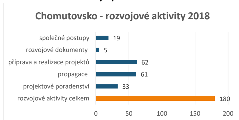
Graf č. 1 Počet rozvojových aktivit CSS za rok 2018

Pro srovnání v roce 2016, tj. na začátku spolupráce obcí ve svazku, kancelář během půlroku své činnosti vykonala celkem 53 aktivity věnované rozvoji obcí a regionu. Z tohoto počtu bylo 11 aktivit na propagaci, 16 aktivit věnovaných přípravě a realizaci projektů, 7 společných postupů a 14 na projektové poradenství.