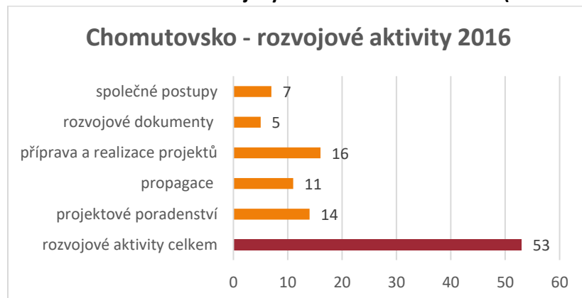
Graf č. 2 Počet rozvojových aktivit CSS za rok 2016 (od 1.7.2016)

Pro srovnání v roce 2016, tj. na začátku spolupráce obcí ve svazku, kancelář během půlroku své činnosti vykonala celkem 53 aktivity věnované rozvoji obcí a regionu. Z tohoto počtu bylo 11 aktivit na propagaci, 16 aktivit věnovaných přípravě a realizaci projektů, 7 společných postupů a 14 na projektové poradenství.